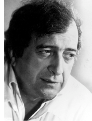
Luciano Berio