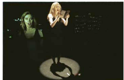
Barbara Hannigan