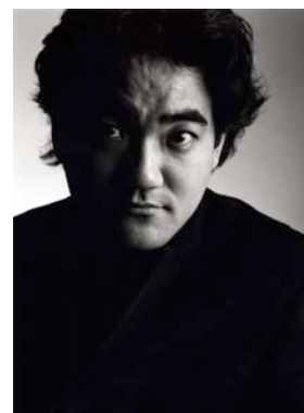
Dai Fujikura

Vassos Nicolaou , Otemo* , commande de l'Ircam-Centre Pompidou, création Georges Aperghis , The only line , création française Dai Fujikura , nouvelle œuvre** , commande de l'Ircam-Centre Pompidou, création Marco Stroppa , hist whist*** , création française, commande du Printemps des Arts de Monaco Luciano Berio , Naturale Projection du film « Images d'une œuvre n° 7 » sur la création de Marco Stroppa