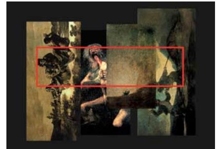
Montage de Carlos Franklin

Coproduction Ircam-Centre Pompidou, l'Itinéraire. Avec l'aide du réseau Varèse, subventionné par le programme Culture 2000 de l'Union européenne.