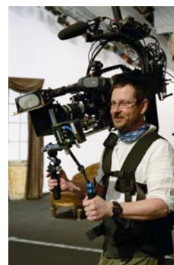
Lars von Trier

En collaboration avec le Département du développement culturel (les Revues parlées)-Centre Pompidou.