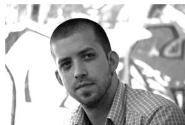
Philipp Maintz

Toshio Hosokawa , Cloudscape György Ligeti , Omaggio a G. Frescobaldi , Coulée Philip Maintz Ferner, und immer ferner , création Hyun-Hwa Cho (création musicale CURSUS 2* )/ Raphaël Thibault (création vidéo) Vox Humana Iannis Xenakis , Gmeeorh